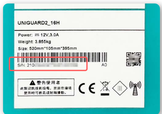
設備外箱貼紙上的S/N碼