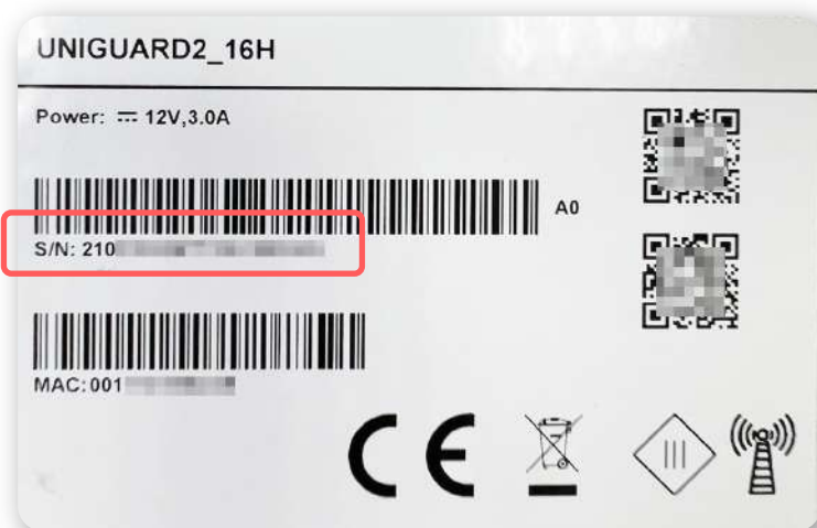
設備本身底部貼紙上的S/N碼